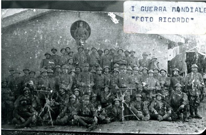
Foto ricordo Battaglione di fanteria